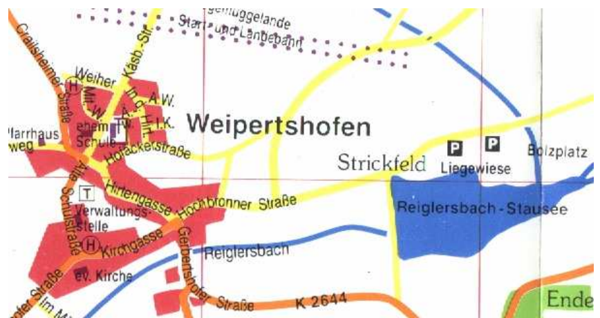
Bild 2 - von Weipertshofen zum Reiglersbach-Stausee

Nur der Vollständigkeit halber sei noch erwähnt: Alternativ zu oben beschriebenem Weg kann man sich auch von der A7 aus, von Abfahrt Dinkelbühl / Fichtenau durch die Wälder und Dörfer schlagen, und sich Weipertshofen von der anderen Seite aus nähern - jedoch ist dieser Weg meines Erachtens nur für Ortskundige zu empfehlen, da nicht ganz so einfach zu erklären und zu finden.